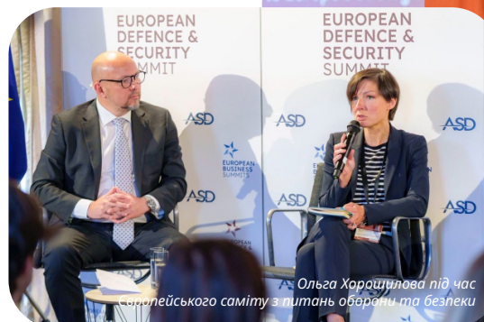
Ольга Харошилова під час Європейського саміту з питань оборони та безпеки